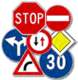
Regolamentazione del traffico