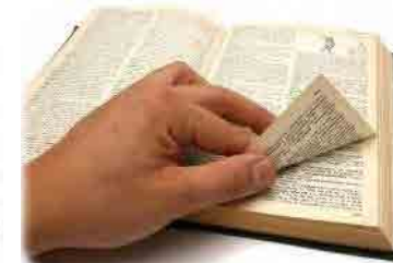
Violazione Regolamenti Comunali