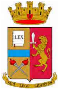
Polizia di Stato