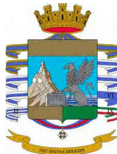
Guardia di Finanza